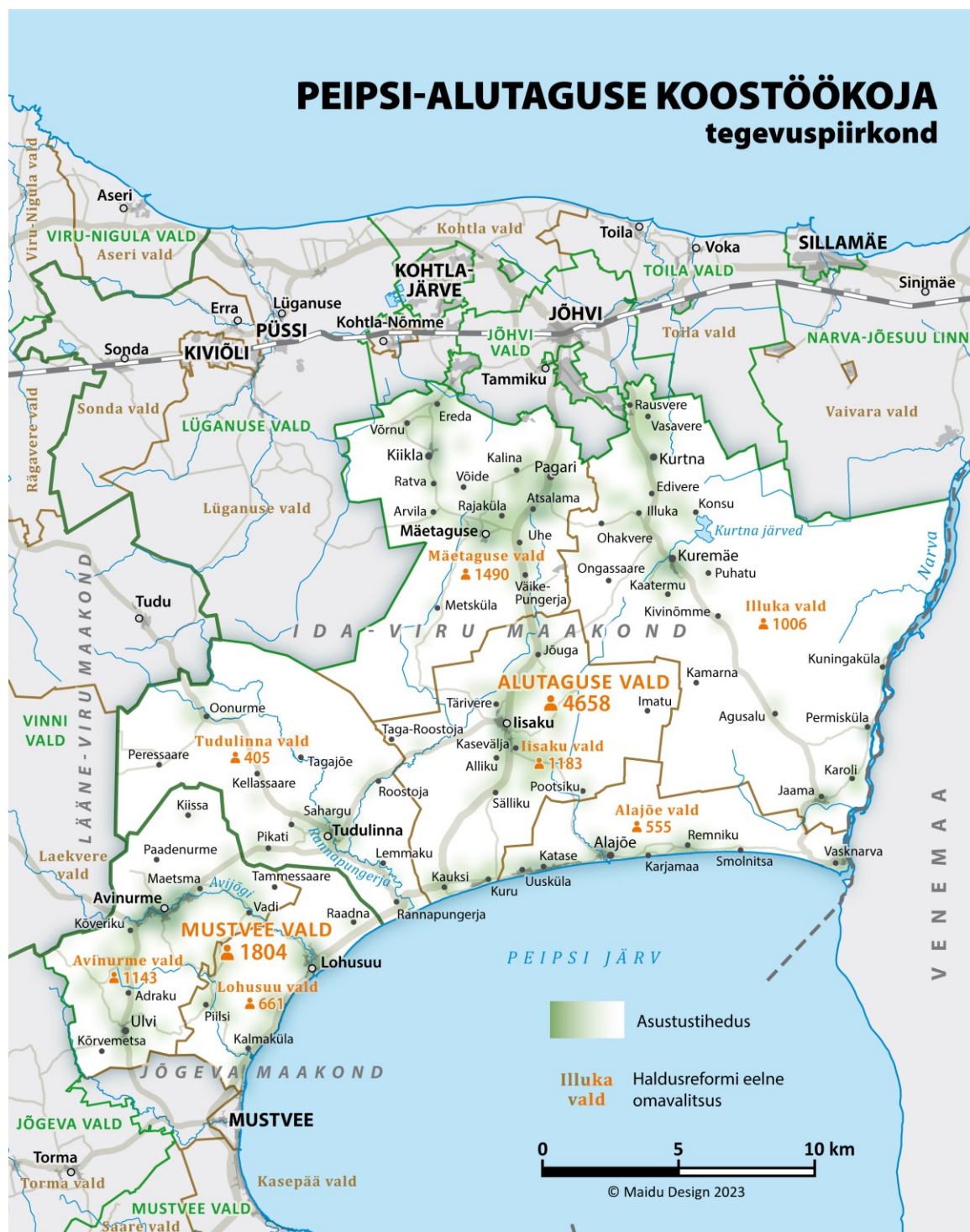
Joonis 1. Peipsi-Alutaguse Koostöökoja tegevuspiirkond (elanike arv seisuga 1.01.22, Rahvastikuregister)

PAKi tegevuspiirkond hõlmab 1757 km 2 suurust ala Ida-Virumaa lõunaosas (Alutaguse vald) ja Jõgevamaa kirdeosas (Mustvee valla Avinurme ja Lohusuu piirkonnad) (Joonis 1).